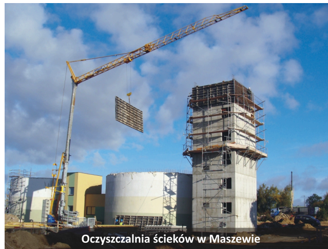
Oczyszczalnia ścieków w Maszewie

kontynuowane są roboty budowlane m. in. infrastruktury oczyszczalni, instalacji mechanicznego zagęszczenia osadu nadmiernego, komór fermentacyjnych, pomieszczeń wymienników ciepła i pomp cyrkulacyjnych, stacji odwadniania osadów, ewakuacji osadu, płukania piasku z kanalizacji, budynku administracyjnego, budynku socjalnego oraz suszarni osadu. Termin zakończenia kontraktu planowany jest na lipiec 2013 r., a przewidywana wartość robót wynosi 53 337 354,60 zł netto.