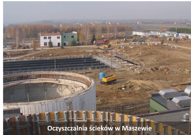
Oczyszczalnia ścieków w Maszewie

W ramach zadania: „ Przebudowa i rozbudowa oczyszczalni ścieków w Maszewie - etap II ”